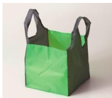
底が正方形でたっぷり入ります