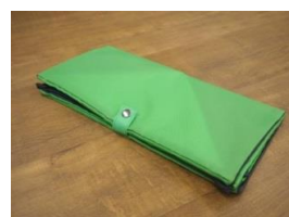
更に半分にたたんでスッキリ