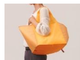
肩にもかけられます