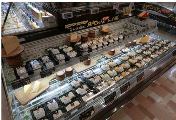
【フレッシュチーズ売場】

店内で適量にカットしたチーズを集めた「フレッシュチーズ売場」を新設しました。「ブリー&クリームラム&クリームチーズ」などワインに合うチーズを豊富に取り揃えています。冷凍食品売場では、簡単便利な冷凍食品の種類を増やし売場を拡大しました。