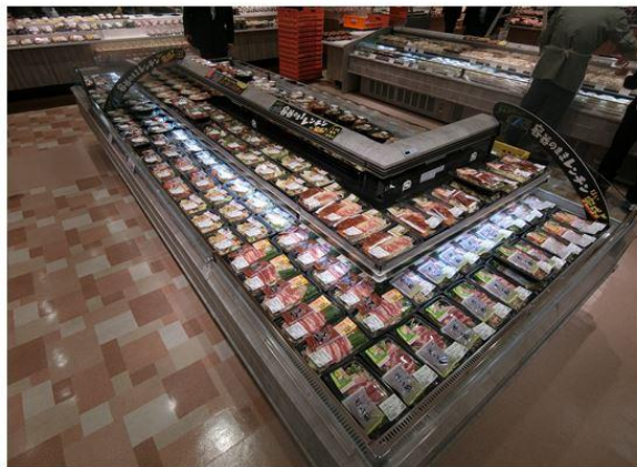
【レンジアップコーナー】