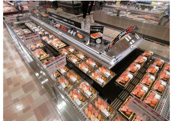
【鮮魚売場にあるお寿司コーナー】