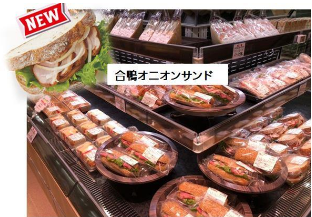
【新商品が並ぶサンドイッチ売場】