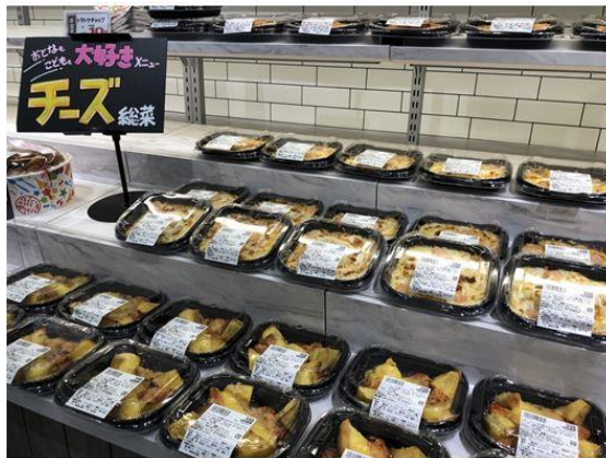
【チーズ総菜コーナー】