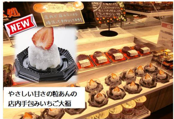
【和スイーツコーナー】