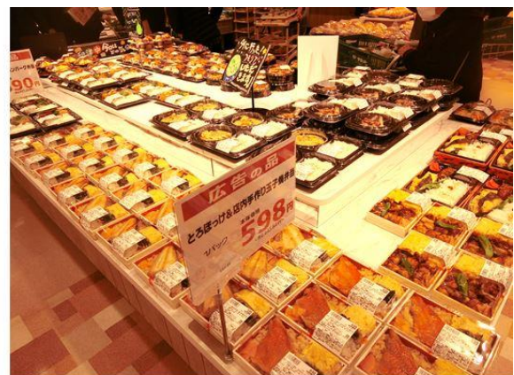
【各部門で販売する素材を使用したお弁当】