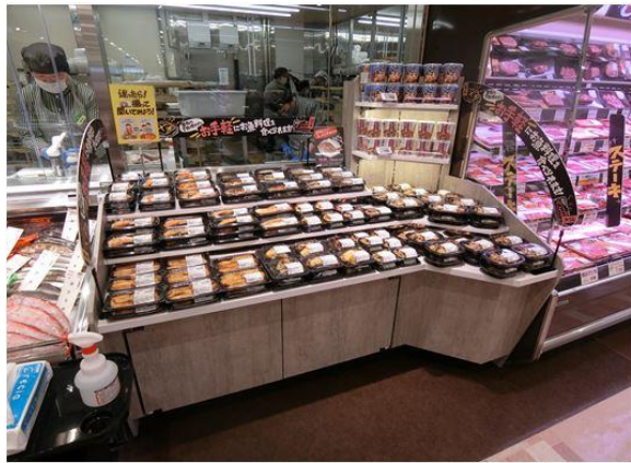
【煮魚・焼魚コーナー】