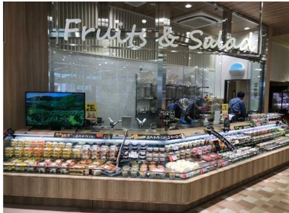
【フレッシュサラダ&カットフルーツコーナー】

新設したコーナーでは、店内で販売している素材を使ったピクルスや野菜スティックなど、店内で手作りしたフレッシュサラダや旬なくだものを盛り込んだカットフルーツを多く取り揃えます。また、サミットオリジナルの北海道牛乳を原料とした手作りの杏仁豆腐に加え、川口青木店から品揃えを開始したバナナムレットなど、店内で手作りしたスイーツも揃えました。