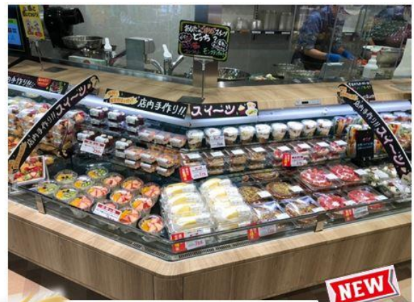
「バナナとクリームのオムレット」