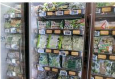
冷蔵野菜は種類が豊富