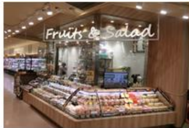
フレッシュサラダ&カットフルーツコーナー