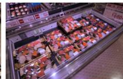
お刺身売場も充実