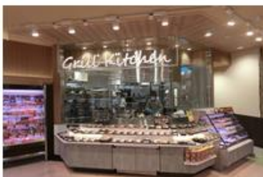
「グリルキッチン」コーナー