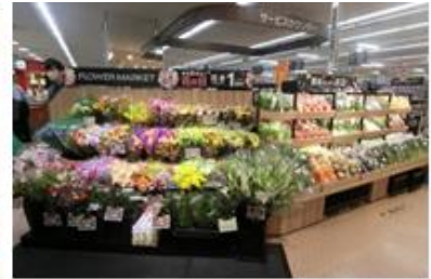
花売場と「農家さんから直送」コーナー