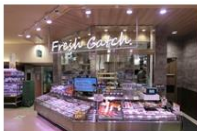
壁面に移設した「おさかなキッチンコーナー」

お客様のご要望に応じた下処理などを行う「おさかなキッチンコーナー」は壁面へ。店内で調理した「煮魚・焼魚」や切りたての「お刺身」も豊富に品揃えしています。