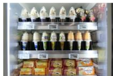
ご当地アイスもあります