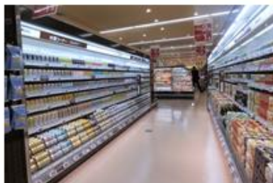
ビール、缶酎ハイ、ノンアルコール飲料の種類が豊富