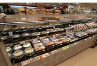
店内製造のレンジアップ商品