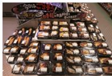
店内で調理した「煮魚・焼魚」