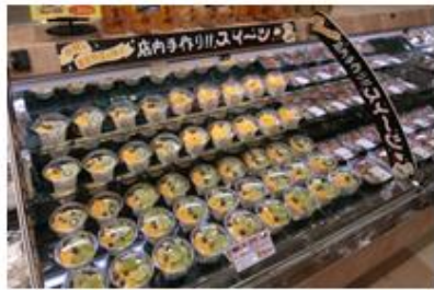
青果売場ではカットフルーツを使った 店内手作りスイーツを販売

また、デザート類も品揃えが充実。青果売場の「フレッシュサラダ&カットフルーツ」コーナーでは「フルーツ杏仁」を、ベーカリー売場の冷蔵ケースでは「フルーツタルト」を作り立てで販売します。さらに、新しくなった日配品売場ではフレッシュデザートの種類を増やし、選ぶ楽しみがあるコーナーを実現させました。