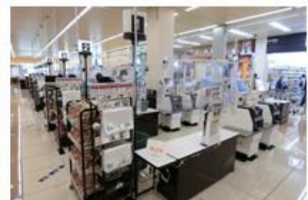
お支払いセルフレジ