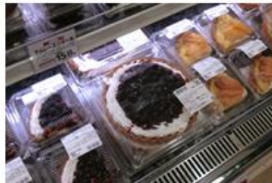
ベーカリー売場ではフルーツタルトも