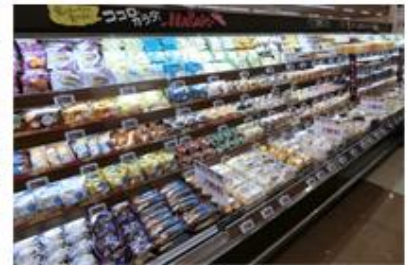
日配品売場のフレッシュデザート コーナー