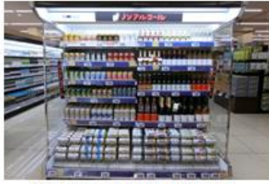
ノンアルコール商品も多数品揃え