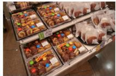
ベーカリー売場でも大容量パックを販売