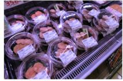
店内手作り海鮮おつまみ

また、デザート類も品揃えが充実。青果売場の「フレッシュサラダ&カットフルーツ」コーナーでは「フルーツ杏仁」を、ベーカリー売場の冷蔵ケースでは「フルーツタルト」を作り立てで販売します。さらに、新しくなった日配品売場ではフレッシュデザートの種類を増やし、選ぶ楽しみがあるコーナーを実現させました。