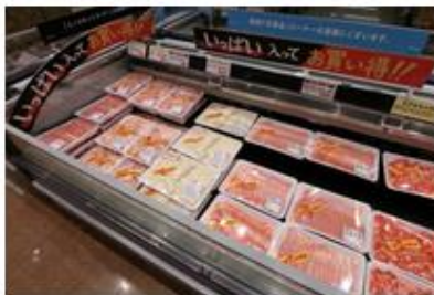
お肉の大容量パックは平冷ケースで