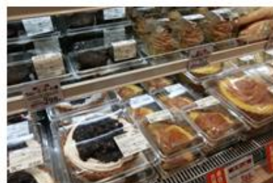
ベーカリー売場の冷蔵ケースでは「フルーツタルト」も販売