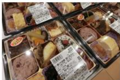
鮮魚売場で販売している「焼魚」を使ったお弁当

総菜売場では、生鮮売場で販売する新鮮な食材を使った寿司や丼物、鮮魚売場の「焼魚・煮魚」や精肉売場グリルキッチンコーナーの「お肉総菜」を使ったお弁当等を取り揃えています。また、ベーカリー売場の冷蔵ケースでは、フルーツをたっぷり使った「フルーツタルト」や精肉売場で販売しているローストビーフを使った「ローストビーフサンド」等も販売しています。