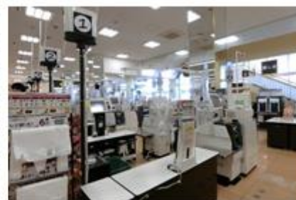
お支払いセルフレジ