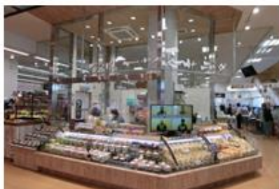
「フレッシュサラダ&カットフルーツ」 コーナーを新設

青果売場には「フレッシュサラダ&カットフルーツ」コーナーを新設しました。専用スライサーでふわふわに仕上げた「ふわシャキ！千切りキャベツ」や、カットフルーツをたっぷり使った「フルーツ杏仁」等も販売。鮮魚・精肉売場では、生鮮素材を使い店内で盛りつけた「ミールキット」、トレーごとレンジ調理もできる味付切身や肉巻き・肉詰め商品、IH コンロにも対応できる店内手作り鍋セットも取り揃えています。