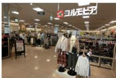
コンパクトながら充実の品揃え