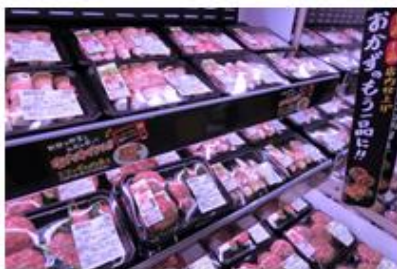
トレーごとレンジ調理できる肉巻き・ 肉詰め商品