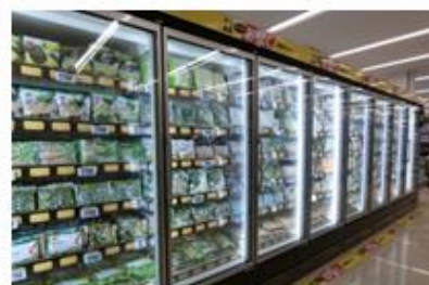
品揃えが大幅に増えた冷凍食品売場