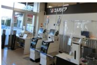
お支払いセルフレジを導入