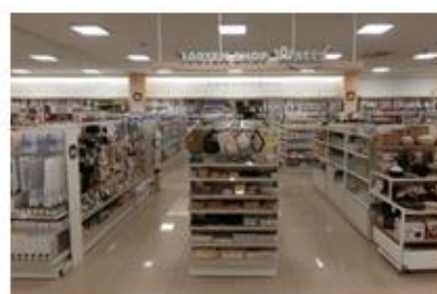
隣には100円均一店「ワッツ」を移設