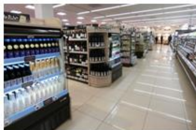
品揃えが豊富なお酒売場

お酒売場では、ビールや缶チューハイ、ワインの売場を広げると共に、若い方に支持の高いフルーツ系のお酒やノンアルコール等の商品も豊富に品揃えしています。更にチーズ売場では、おつまみに最適なチェダーやブリー等のナチュラルチーズを、店内で適量にカットして販売します。また、冷凍食品売場では新たな冷凍ケースを導入して品揃えを約2.5倍に増やし、冷凍野菜・果実や冷凍スイーツ、お弁当用商品のコーナーを拡大しました。