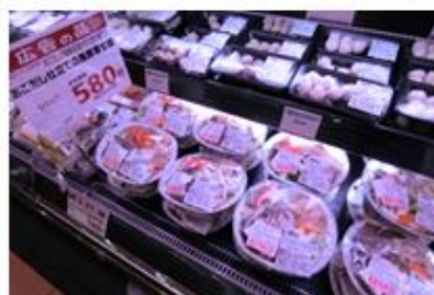
店内手作り鍋セットは鮮魚売場と 精肉売場で販売