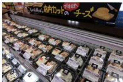
店内でカットしたナチュラルチーズ