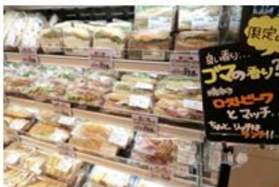
精肉売場で販売している「ローストビーフ」を使ったサンドイッチ